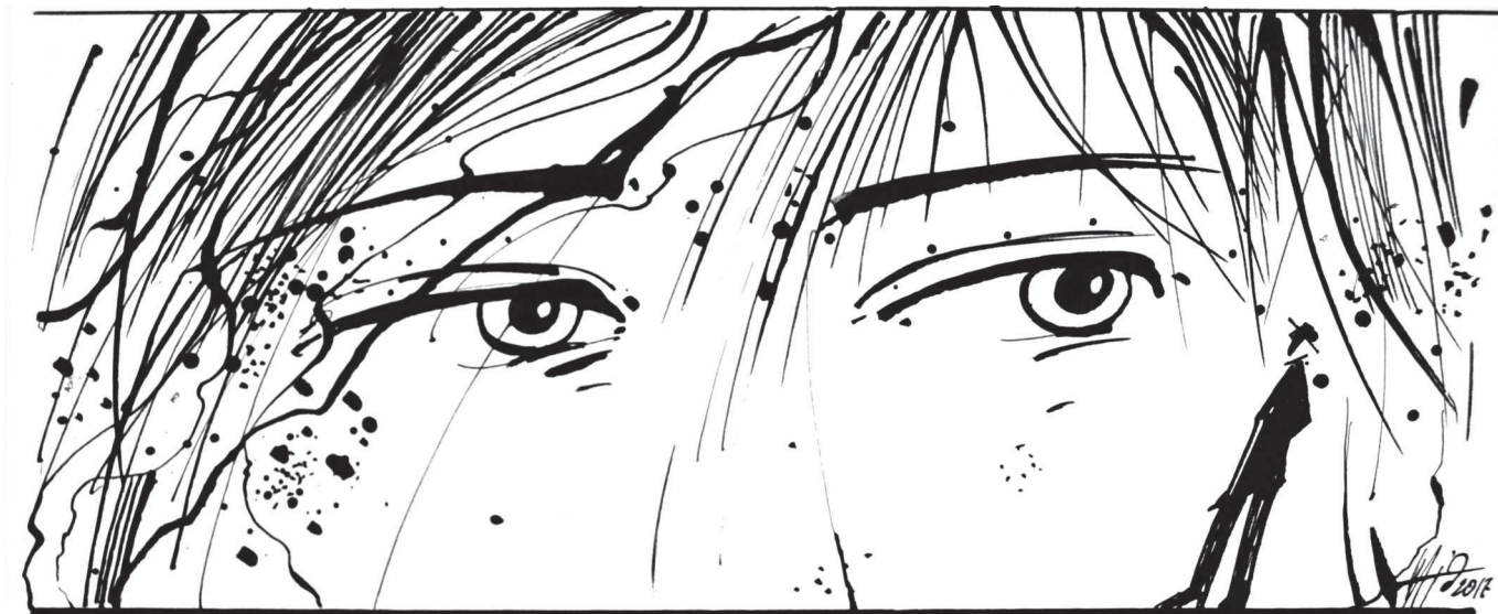
Valentino AJAUSKO piešinys

Už krosnies, tarp avių, tysojo dar vienas gultas. Jame, avikailiais apklotas, gulėjo senas žmogus. Temyros žmogus... Prieš kiek metų Temyra jį pamatė? Atrodo, kalnai dienų pralingavo. Tik - septyni pavasariai žydėjo... Jaunutę mergaitę žilabarzdis senis pasigavo ir ištarė: „Aš